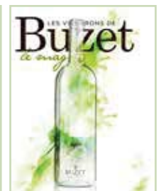
▲ Saint Émilion-Limouxin-Bourgogne-Costières de Nîmes