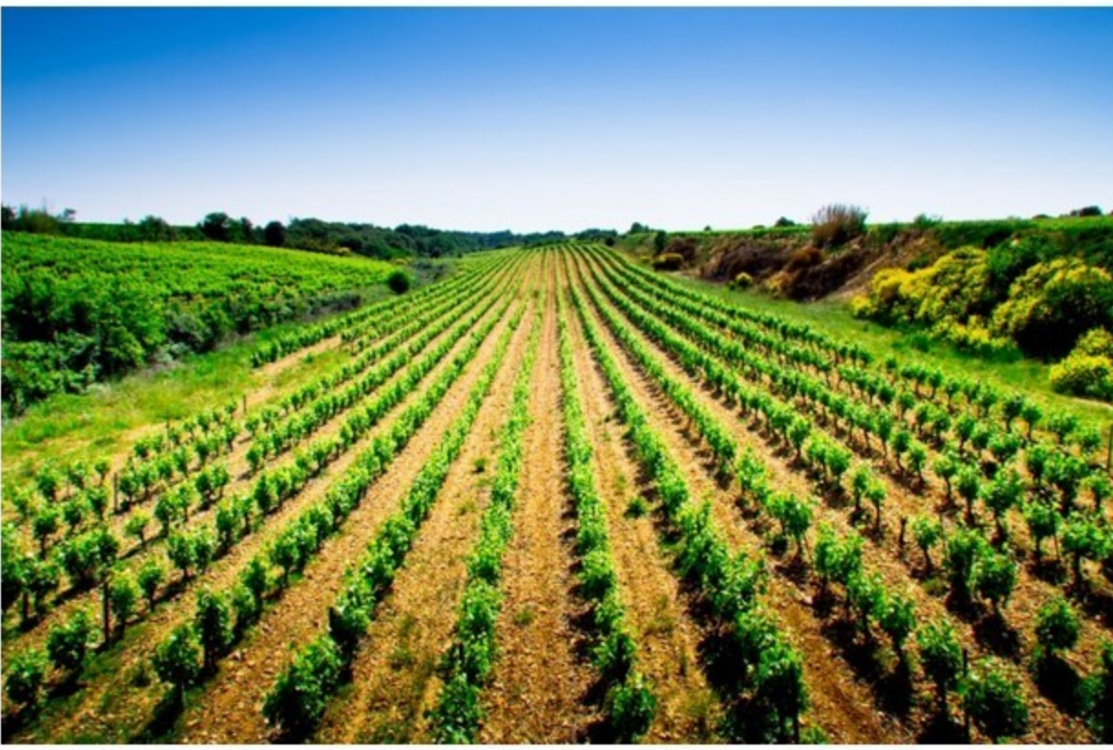
La sécheresse languedocienne a pu carencer les vignes.

Après une année extrêmement sèche, l'ingénieur œnologue Matthieu Dubernet a lancé l'alerte et enjoint tous les vignerons languedociens à réaliser des apports de minéraux foliaires dès les premiers stades du millésime 2024.